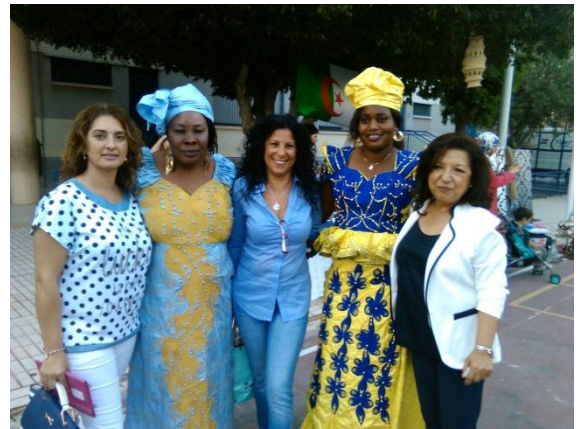
Trabajo con otras asociaciones NO GITANAS en fomento de la interculturalidad y el intercambio de la acción social