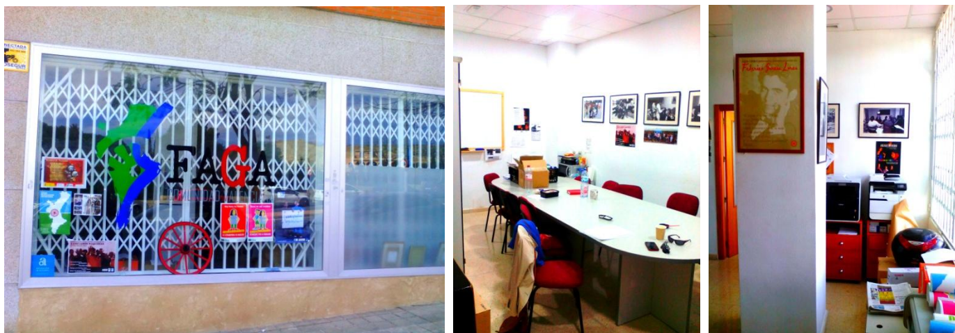
Fotos Sede de FAGA

FOTOS DE LA ENTIDAD Y DE ACTIVIDADES DIVERSAS CON IMPLICACIÓN DE ASOCIACIONES FEDERADAS DE ALICANTE Y MURCIA.