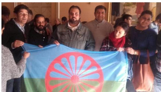
Homenaje a las Víctimas Gitanas del Samudaripen