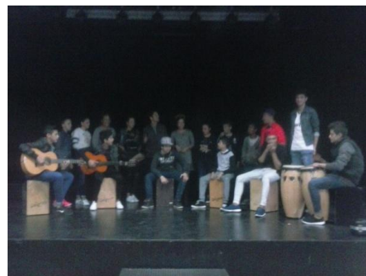
Con la Asociación Chachipen de El Campello

FAGA, Federación de Asociaciones Gitanas de la Comunidad Valenciana.