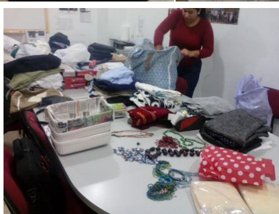
Entrega de enseres a las asociaciones federadas gracias a la asociación Alan´s Home