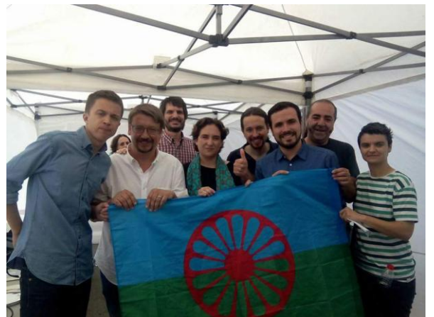
Acciones de potenciar el compromiso político con la promoción del Pueblo Gitano, asociaciones nacionales y FAGA.

FAGA, Federación de Asociaciones Gitanas