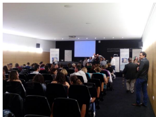
Diversas asociaciones federadas en acciones formativas de salud. Jornada 20 octubre Alicante

FAGA, Federación de Asociaciones Gitanas de la Comunidad Valenciana.