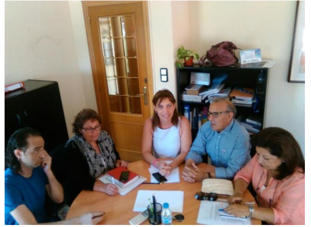
Reuniones de coordinación y trabajo con administraciones públicas: Ej; FAGA, Asociación Ilicitana de Carrús y Arakerando con equipo técnico del ayuntamiento de Elche.