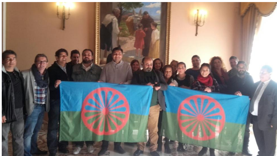
Asociaciones diversas; FGG, Gitanos Rumanos, La Fragua, Arakerando, Chaborrillos Kalos...